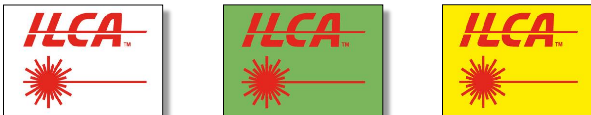
Figura 1 - Segnali esposti dalla BARCA COMITATO (rispettivamente per ILCA 7, ILCA 6 e ILCA 4)