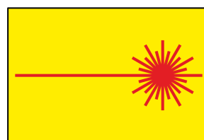
Figura 2 - Segnali esposti da ALTRE IMBARCAZIONI DEL CdR (rispettivamente per ILCA 7, ILCA 6 e ILCA 4)