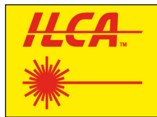
Figura 1 - Segnali esposti dalla BARCA COMITATO (rispettivamente per ILCA 7, ILCA 6 e ILCA 4)