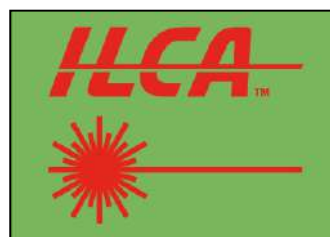
ILCA 6 M/F – ILCA 4